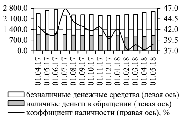
Рис. 1. Динамика национальной денежной массы, млн руб.

Объём денежной массы, номинированной в иностранной валюте, сократился на 3,6%, до 5 103,0 млн руб. (рис. 2). Таким образом, коэффициент валютизации совокупного денежного предложения составил 66,5% (-1,4 п.п.).