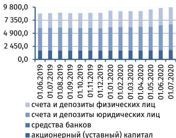
Рис. 1. Динамика основных видов пассивов, млн руб.

Балансовая стоимость акционерного капитала коммерческих банков осталась на уровне начала отчётного месяца – 1 664,8 млн руб. (рис. 1).