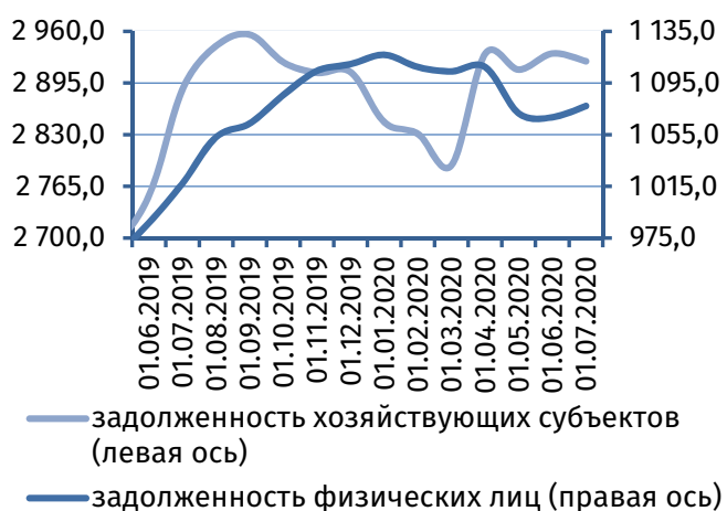
Рис. 4. Динамика задолженности по кредитам, 2 млн руб.

Результаты деятельности коммерческих банков республики в июне 2020 года характеризовались формированием чистой прибыли в сумме 8,6 млн руб. (в мае 2020 года – 5,7 млн руб.).