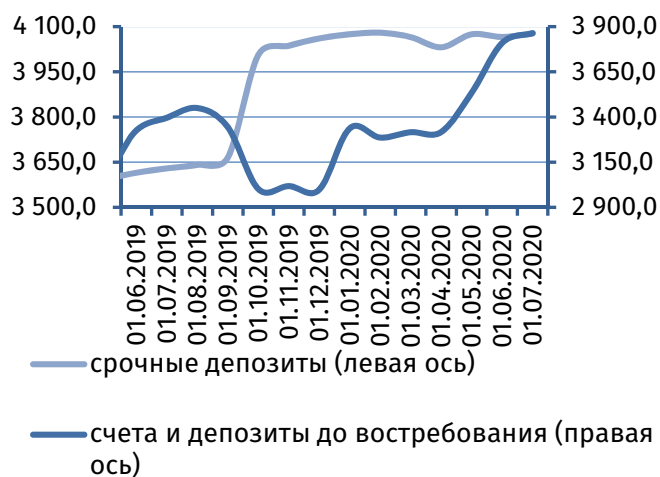
Рис. 2. Динамика депозитной базы, млн руб.

Совокупная величина клиентской базы 1 расширилась на 66,1 млн руб. (+0,8%), составив 7 942,5 млн руб. Основным фактором явилось увеличение онкольных обязательств на 54,6 млн руб. (+1,4%), до 3 865,0 млн руб., тогда как пополнение срочной депозитной базы было более умеренным – +11,6 млн руб. (+0,3%), до 4 077,6 млн руб. (рис. 2).