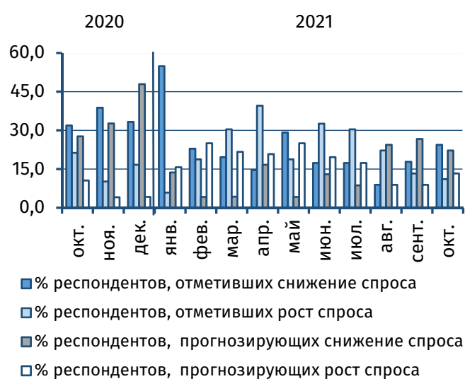
Рис. 2. Оценка текущего и прогнозного уровня спроса, % от общего числа респондентов

Ожидания приднестровских экономических агентов в отношении дальнейшей динамики объёма выпуска и спроса улучшились. Так, увеличение данных параметров в ближайшей перспективе прогнозируют 26,7% (+6,7 п.п.) и 13,3% (+4,4 п.п.) респондентов соответственно; снижение – по 22,2% опрошенных (против 28,9% и 26,7% в сентябре (рис. 2, 3)). По оценкам 37,8% руководителей, объём выпуска сохранится на прежнем уровне. Половина респондентов полагает, что прежним останется и спрос.