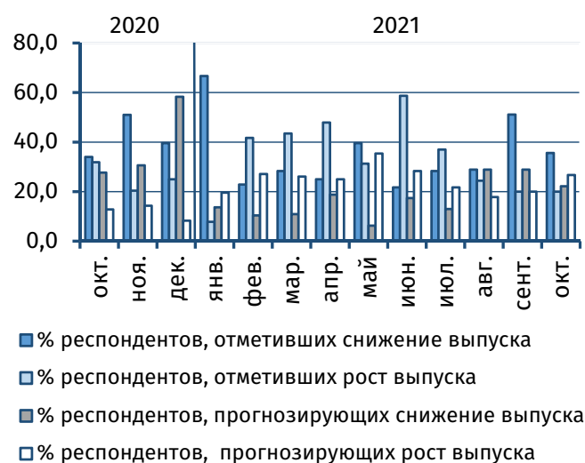
Рис. 3. Оценка текущего и прогнозного объёма выпуска, % от общего числа респондентов